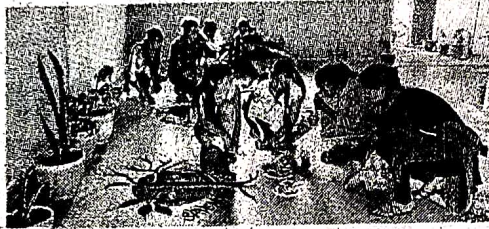
कांकेर। पर्यावरण संरक्षण को लेकर छात्राओं ने बनाई रंगोली।

मुख्य अतिथि एआर धिटे ने खेल को जीवन का अनिवार्य अंग बताया। उन्होंने कहा कि कोई भी एक विधा चुन लो उसके बाद उसमें आगे बढ़ो आपके पास असीम संभावनाएं हैं। खासकर लड़कियों के लिए पूरी दुनिया में परचम लहराने का मौका है। गो-ग्रीन थीम पर प्रतियोगिताओं का आयोजन किया गया। सर्वप्रथम पर्यावरण