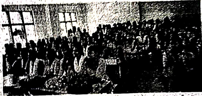
कार्यक्रम में मौजूद छात्राएं।