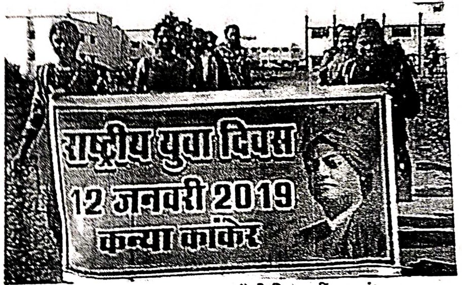
रैली...राष्ट्रीय युवा दिवस पर जागरूकता रैली निकालती छात्राएं।