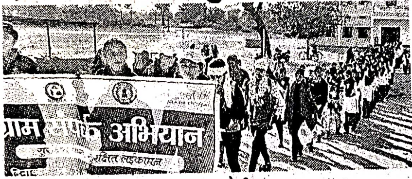
कांकेर। छात्राओं ने निकाली जागरूकता रैली।

कांकेर। इंदरू केंवट शासकीय कन्या महाविद्यालय के एनएसएस छात्राओं ने सुरक्षित पारा, सुरक्षित लईकामन के बाल अधिकार एवं संरक्षण विषय को लेकर जागरूकता महारैली निकली। रैली का ग्राम पंडरीपानी के आंगनबाड़ी केंद्र एवं प्राथमिक शाला भवन से शुरू कर मैन रोड से होते हुए माटवाड़ा के पंचायत भवन, प्राथमिक शाला भवन, मुख्य गली, डुमाली का भ्रमण किया।