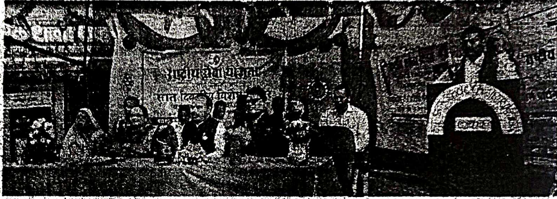
शिविर को विशिष्ट जनों ने भी संबोधित किया।