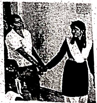
पखांजूर। कुरेनार स्कूल में छात्राओं को दी गई सुरक्षा की जानकारी।

पखांजूर/बांदे थाना की रक्षा टीम ने धुरनक्सल प्रभावित क्षेत्र ग्राम कुरेनार के शासकीय हायर सेकेंडरी स्कूल की छात्राओं को छेड़छाड़, अभद्र टिप्पणी से बचाव, गुड टच-बैड टच की जानकारी दी। इसके साथ ही आत्मरक्षा के लिए अपने पास रखे सामानों को हथियार के रूप में इस्तेमाल करने का तरीका बताया गया। टीम के सदस्यों ने छात्राओं को इसका अभ्यास भी कसाया।