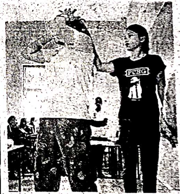
इंदरू कैंवट शासकीय कन्या कॉलेज में आत्मसुरक्षा के लिए जागरूक कार्यक्रम में उपस्थित छात्राएं।