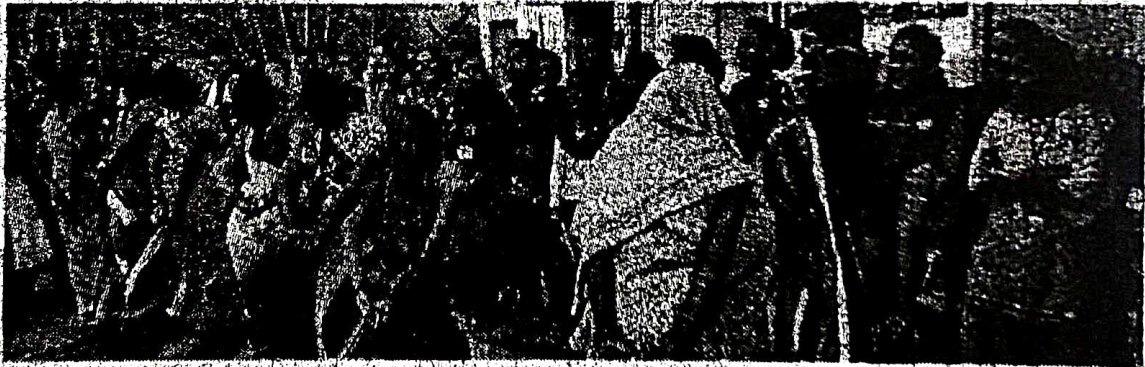
महिलाओं के बीच हुई मनोरंजक जलेबी दीड़ प्रतियोगिता।